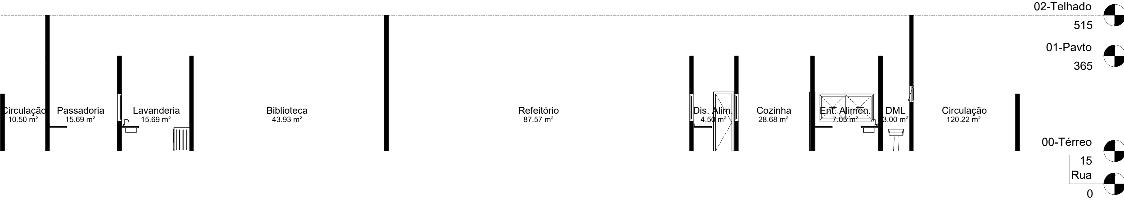
1 CORTE CC' 1 : 100